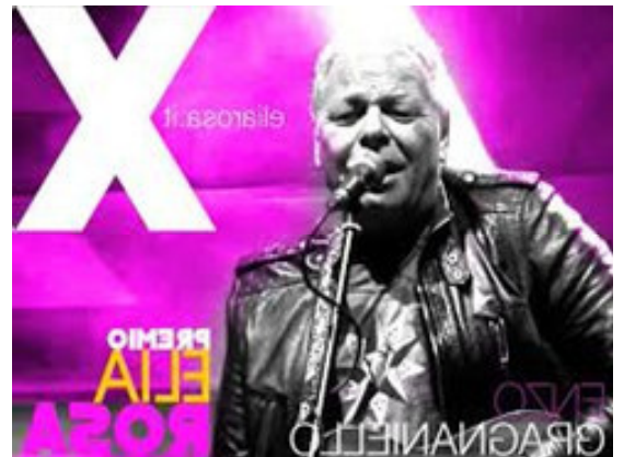
X EDIZIONE Direttore artistico: ENZO GRAGNANIELLO