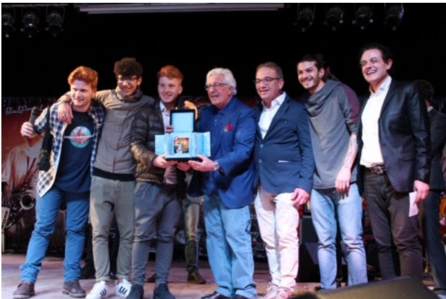
IX EDIZIONE Direttore artistico: PEPPINO DI CAPRI