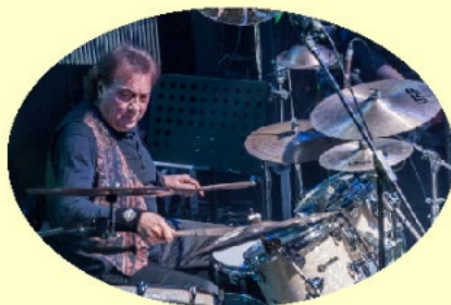
TULLIO DE PISCOPO